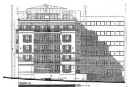
Façade sur le château