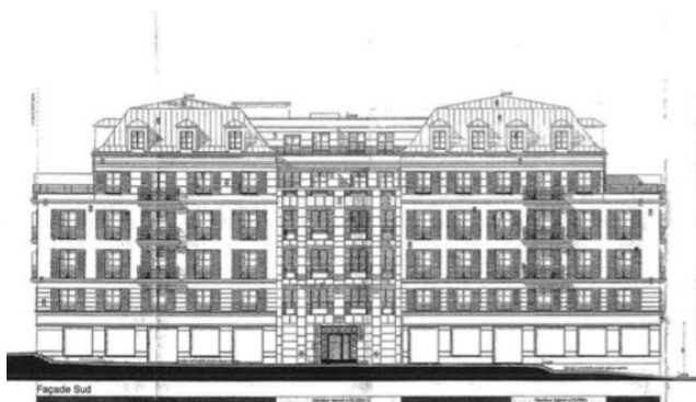
Façade sur la place

Documents du permis de construire n° PC 92032 18 00261 délivré 25 octobre 2019 par le Maire au nom de la commune et affiché en Mairie le 5 novembre 2019, pour la construction d'un ensemble immobilier sur un terrain sis 2 avenue de Verdun - 92260 Fontenay-aux-Roses.